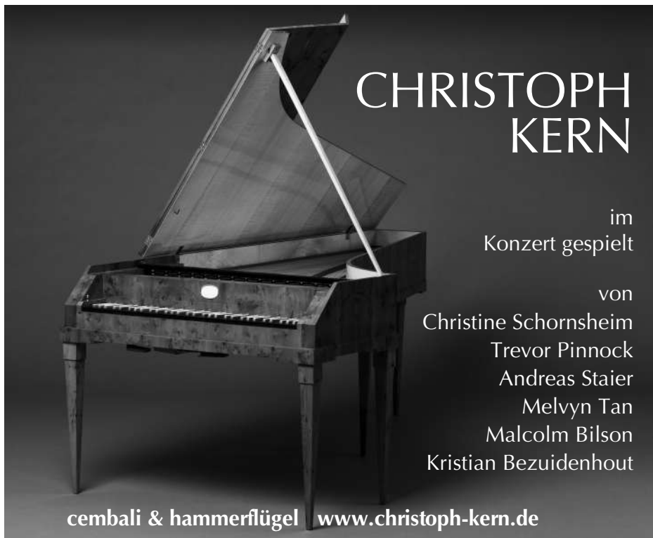
Kategorie II: Nr. 81 – 150